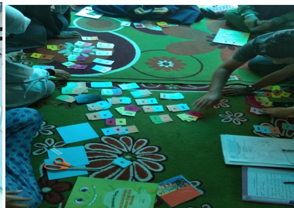
Gambar 2. Pemberian dan Sosialisasi Materi ABA VB Gambar 3. Pemberian & Sosialisasi Materi ABA VB

Gambar di atas menjelaskan proses pelaksanaan kegiatan pengabdian masyarakat tentang pemberian terapi mandiri orangtua untuk anak dengan gangguan speech delay selama di rumah. Kegiatan ini dilaksanakan selama pandemi Covid-19 yang bertempat di Yayasan Bintang Kecil, dimana tim dari Fakultas Psikologi terlibat langsung dengan orangtua serta tetap memperhatikan protokol kesehatan. Kendala dalam penelitian ini adalah dikarenakan orangtua bekerja, waktu orangtua yang harus disesuaikan dengan kegiatan pengabdian, dan konsistensi orangtua dalam pemberian terapi untuk anak.